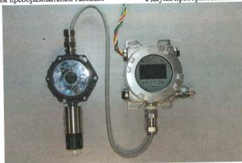
б) Газоанализатор Vector с выносным преобразователем газовым