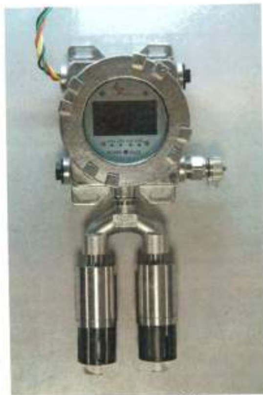
б) Газоанализатор Vector с двумя преобразователями газовыми