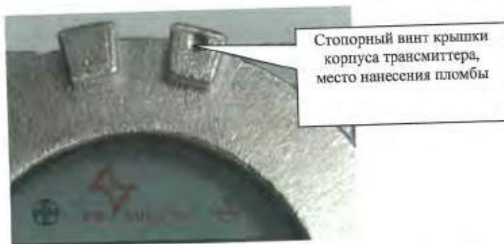
Рисунок 2 - Схема пломбировки газоанализаторов от несанкционированного доступа