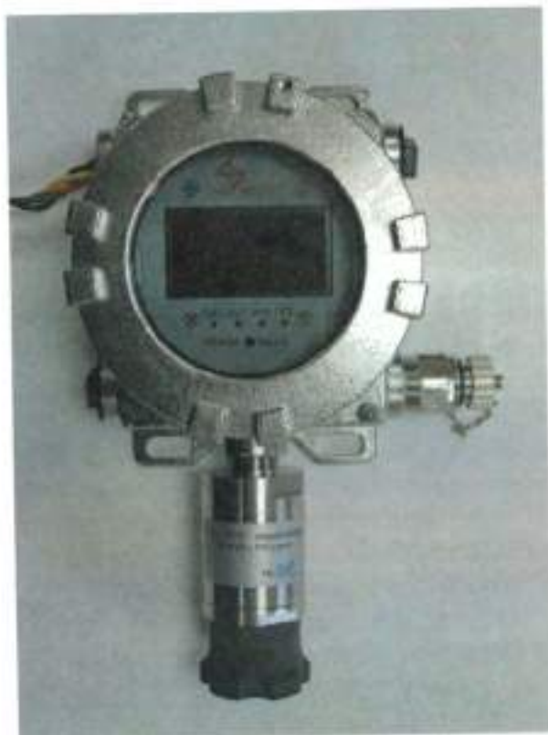
а) Газоанализатор Vector с одним преобразователем газовым

Общий вид газоанализаторов приведен на рисунке 1. Схема пломбирования газоанализаторов от несанкционированного доступа приведена на рисунке 2.